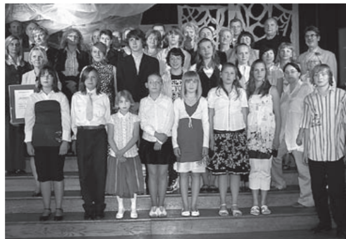
Powiatowi Laureaci Złotych Sów.