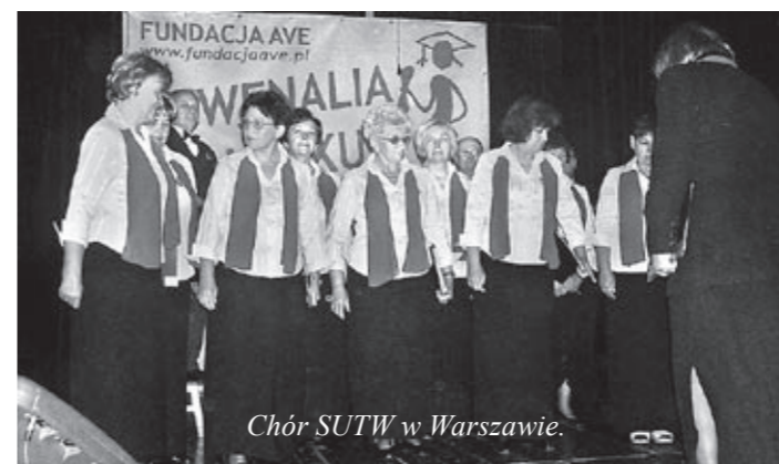
Chór SUTW w Warszawie.