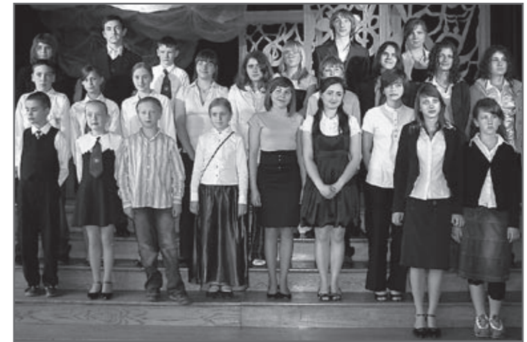
Absolwenci obornickich szkół, którzy w w swoich szkołach osiągnęli najlepszy wynik:

Już po raz czternasty Kolegium Dyrektorów Szkół Gminy Oborniki Śląskie przygotowało spotkanie absolwentów, którzy osiągnęli najlepsze wyniki w roku szkolnym 2008/2009, z Burmistrzem Obornik Śląskich. Gminne podsumowanie odbyło się 16 czerwca 2009 w sali widowiskowej OOK.