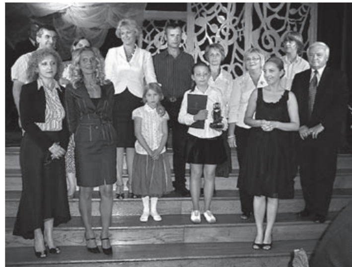
Oborniccy Laureaci Złotych Sów.