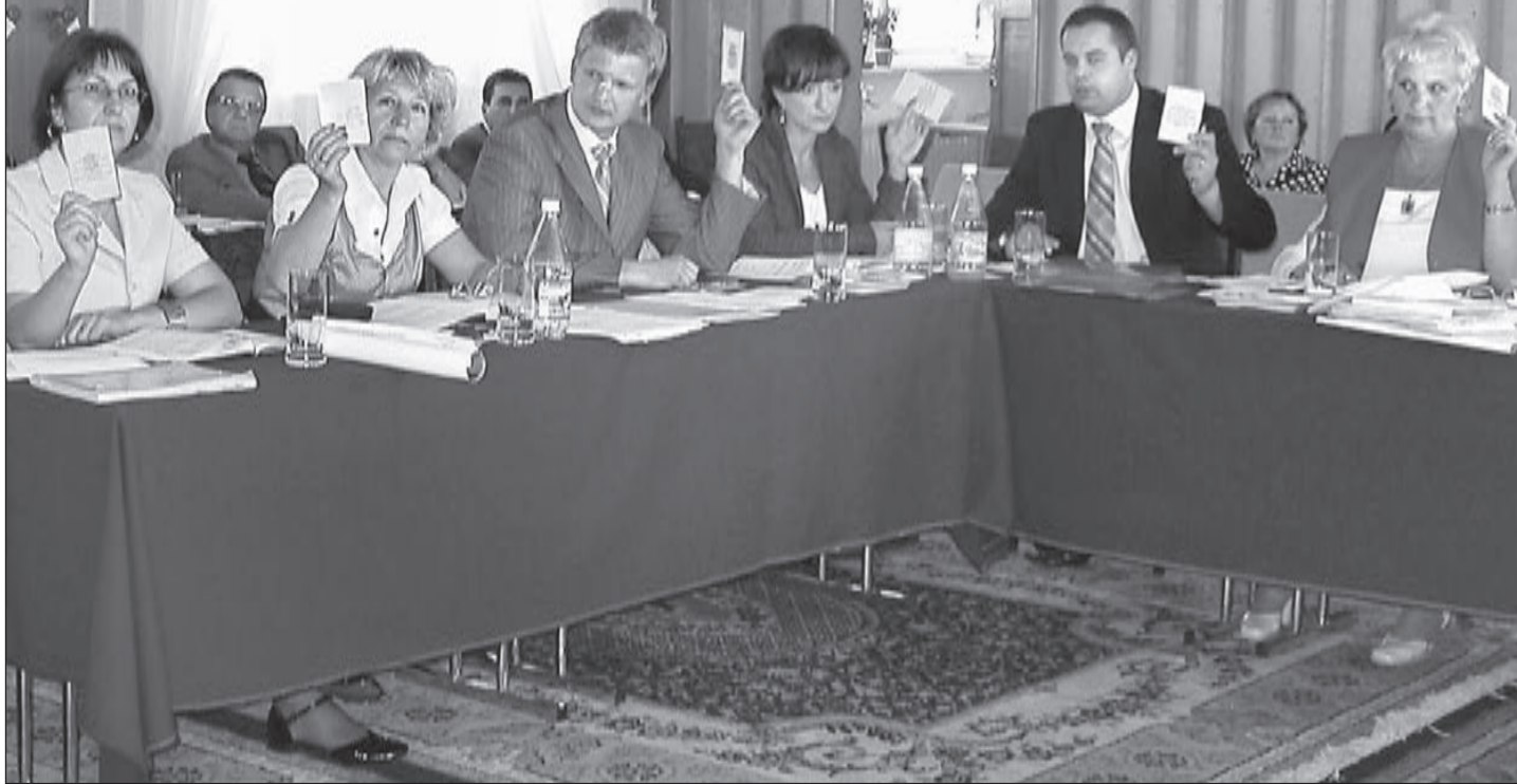
Głosowanie nad udzieleniem absolutorium za 2008 – jednogłośnie.

T ak niedawno świętowaliśmy nadejście nowego, 2009 roku, a tymczasem kilka dni temu minęła już jego jedna trzecia. Pora więc krótko przedstawić już tegoroczne dokonania oraz nasze zamierzenia na najbliższą przyszłość.