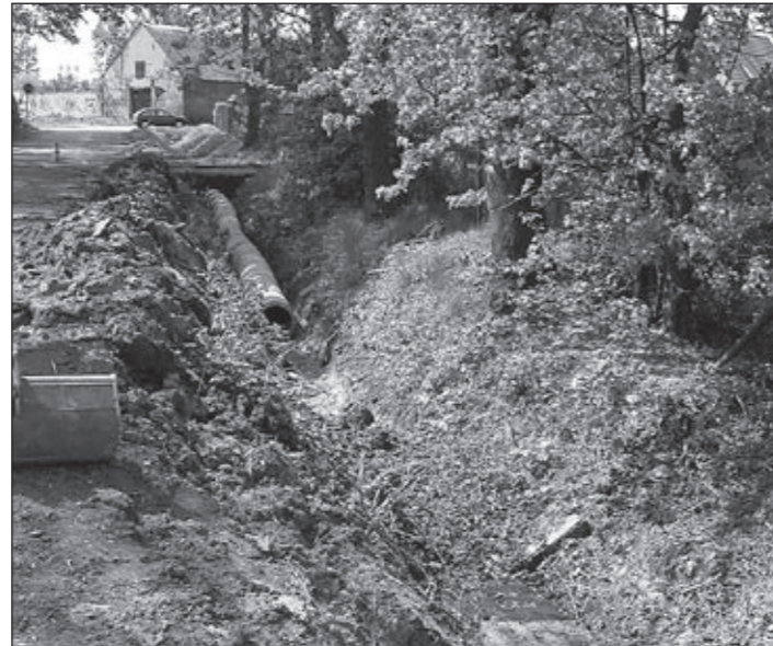
Budowa odwodnienia drogi w ulicy Poprzecznej w Pęgowie.