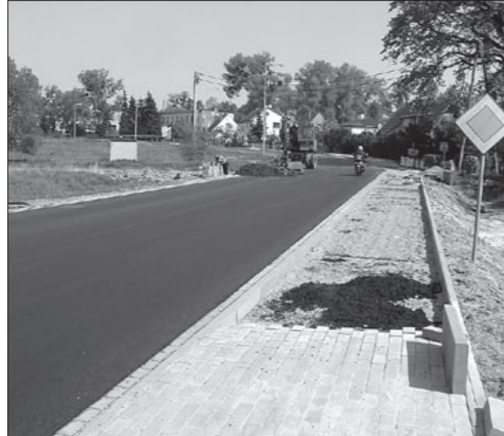
Budowa chodnika i remont jezdni w ulicy Siemianickiej (inwestycja wspólna ze Starostwem Powiatu Trzebnica).