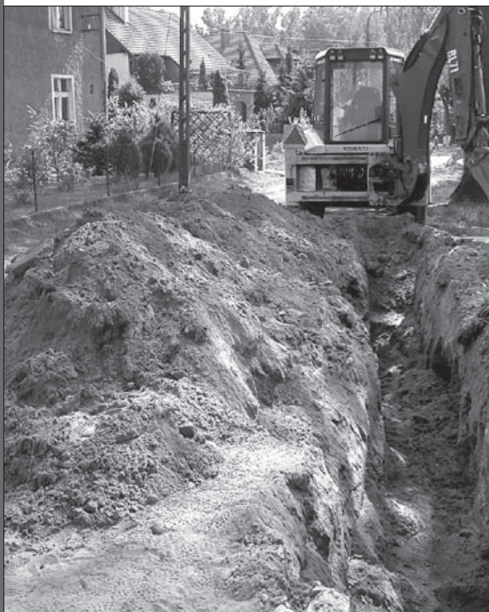
Wykopy w ulicy Rycerskiej

Celem inwestycji jest wykonanie kanalizacji sanitarnej dla zabudowy mieszkaniowej w rejonie ulicy Rycerskiej w Obornikach Śląskich. Kanalizacja sanitarna wpięta będzie w rejonie skrzyżowania ulic Wolności i Siemianickiej.