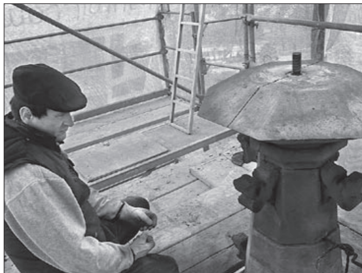
Wieża – najwyższy poziom.

Trwa zbiórka środków potrzebnych na sfinansowanie remontu, które gromadzone są na specjalnym rachunku w Banku Spółdzielczym w Obornikach Śl. o nr 96 9583 0009 0011 8330 2000 0001. Do chwili obecnej na konto wpłynęło kilkanaście tysięcy złotych (w tym datki w kopertach), oraz 200.000 z kasy Gminy Oborniki Śląskie.