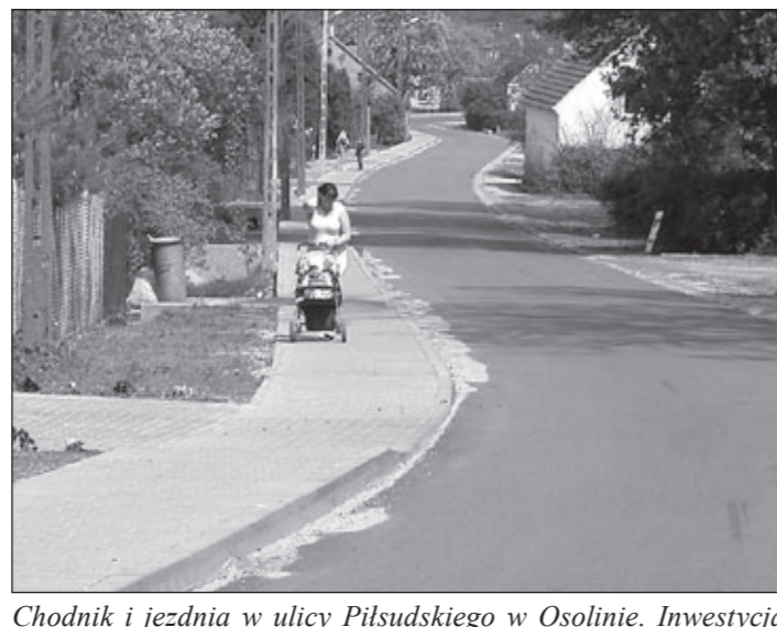
Chodnik i jezdnia w ulicy Piłsudskiego w Osolinie. Inwestycja wspólna z DSDiK.