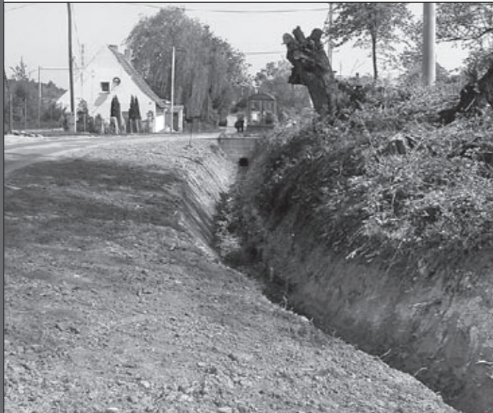
Odbudowa rowu melioracyjnego w Piekarach.