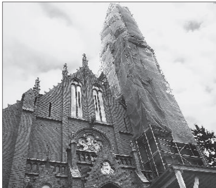
Wieża z zewnątrz.

Od 17 listopada 2008 trwają prace związane z remontem wieży kościoła NSPJ. Pisaliśmy o tym szerzej w numerze 6 NP z 6 lipca 2008. Stare, zmurszałe fugi będą zastąpione nowymi.