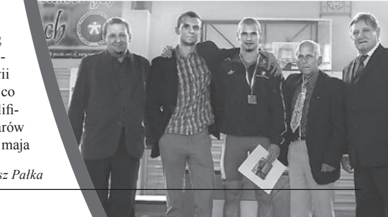
Przedstawiciele Obornik z trenerem i medalistą.