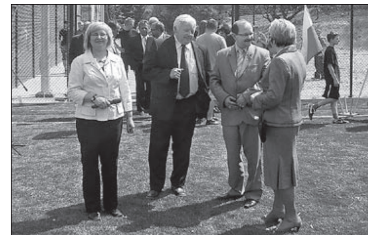
i po otwarciu.

Środki udostępnione przez stronę samorządową: Gmina Oborniki Śląskie poniosła pozostałe koszty w wysokości 409.752,- zł związane z ww. inwestycją. Wartość inwestycji ogółem: 609.752,- zł