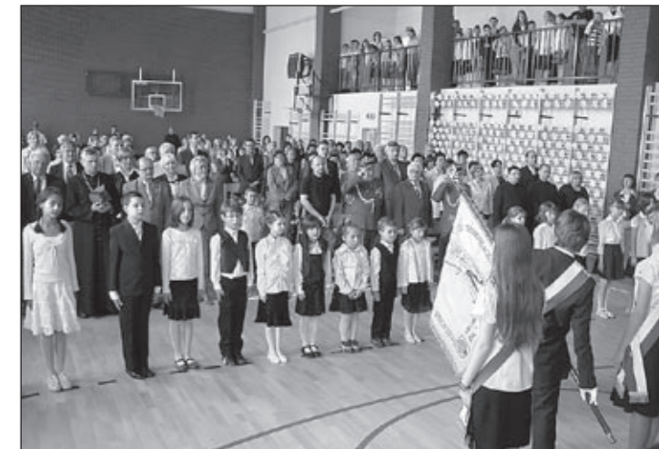
Przyrzeczenie na sztandar złożone przez reprezentantów uczniowskiej społeczności.