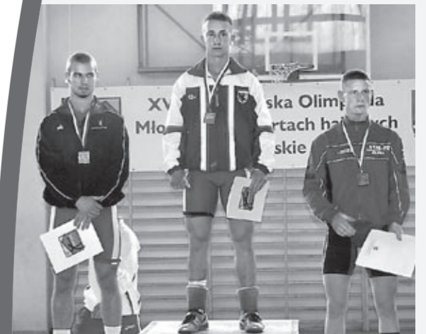
Podium kategorii 69 kg.