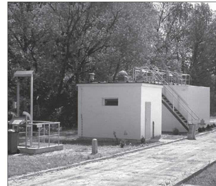
Oczyszczalnia ścieków Kowale.