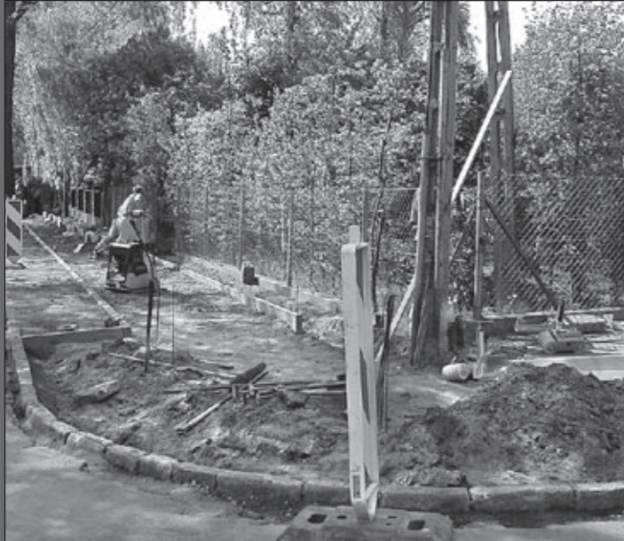
Budowa chodnika w ulicy Dębowej (przedłużenie chodnika ulicy Powstańców Wielkopolskich).