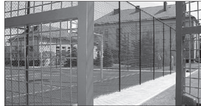
Boisko „Orlik” w Osolinie.