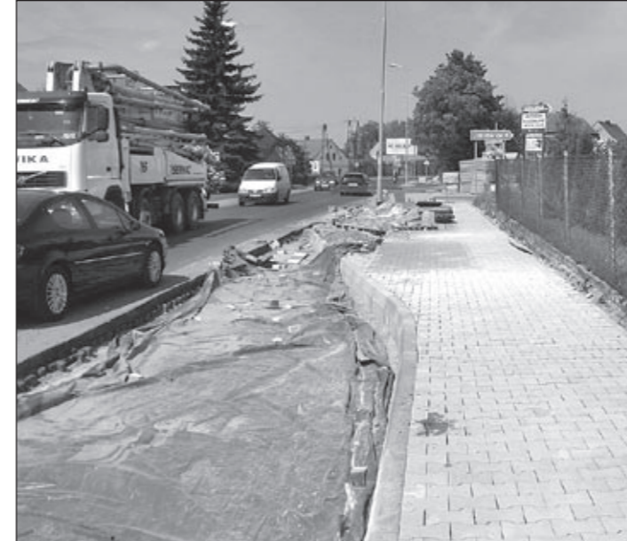
Budowa chodnika z zatoczkami autobusowymi w ulicy Głównej w Pęgowie. Inwestycja wspólna z DSDiK Wrocław.