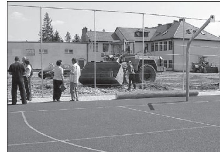
Teren pomiędzy boiskiem a szkołą jest przeznaczony pod rozbudowę pęgowskiego gimnazjum.