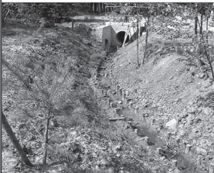
Odbudowa rowu melioracyjnego w Przeclawicach.