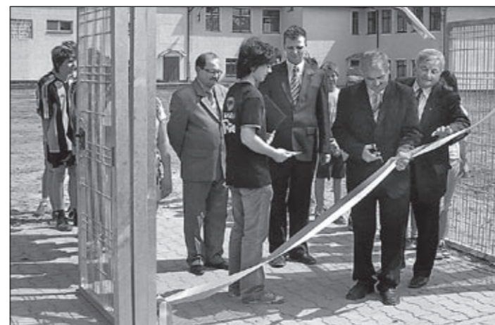
Otwarcie boiska w Pęgowie...

Gmina Oborniki Śląskie poniosła pozostałe koszty w wysokości 464.340,- zł związane z ww. inwestycją. Wartość inwestycji ogółem: 1.130.340,- zł