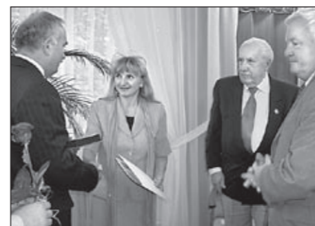
Uchonorowanie OOK przez Kombatantów.

Wszyscy uczestnicy konkursu zostali nagrodzeni pięknie wydаныmi książeczkami.