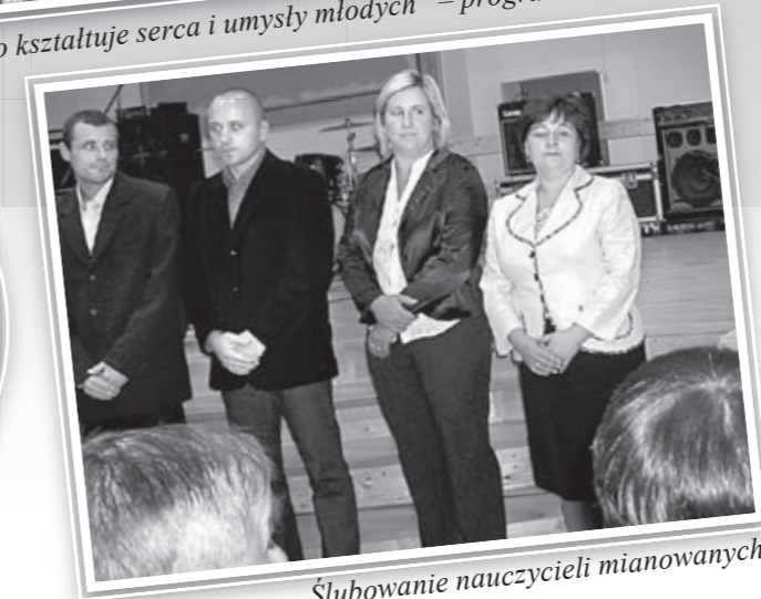
Ślubowanie nauczycieli mianowanych.