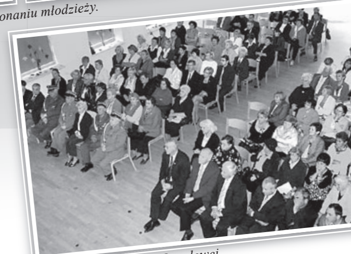
Goście Dnia Edukacji Narodowej.

opiekę i troskę nad miejscami pamięci narodowej w gminie Oborniki Śl. W części oficjalnej odbyło się również zaprzysiężenie nauczycieli mianowanych oraz uhonorowanie listami gratulacyjnymi tych nauczycieli, którzy w tym roku otrzymali najwyższy stopień awansu zawodowego – tytuł nauczyciela dyplomowanego. Ważnym punktem uroczystości było wręczenie nagród burmistrza dla wyróżniających się nauczycieli.