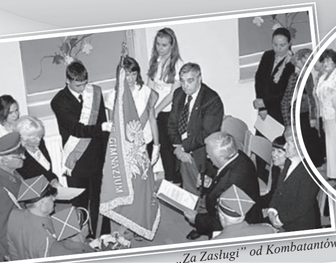
„Za Zasługi” od Kombatantów.