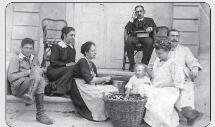
Kobylec 1923.