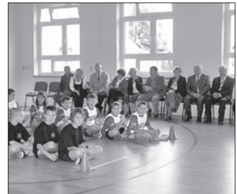
Zaproszeni goście i szkolna młodzież przed rozgrywkami sportowymi na wesoło.