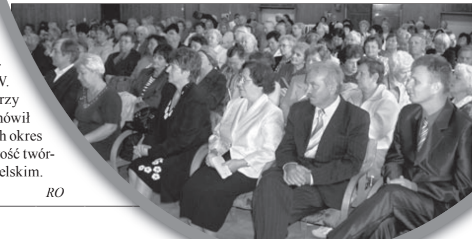
Goście i słuchacze UTW „ATENA”.