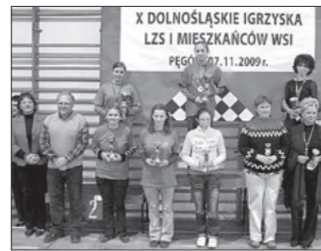
Najlepsze Seniorki i najlepsi Seniorzy