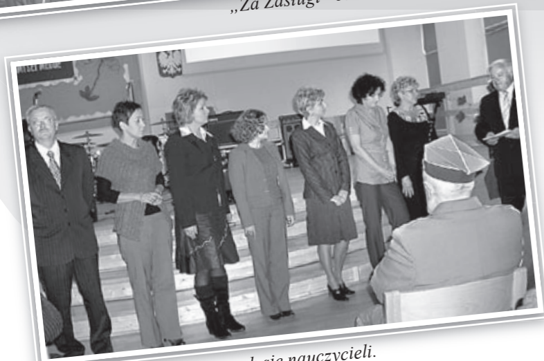
Nagrody dla wyróżniających się nauczycieli.