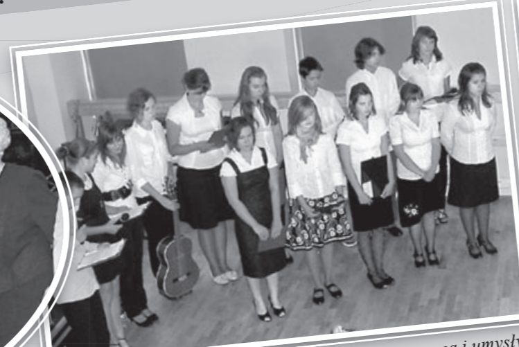
„Ten, co kształtuje serca i umysły młodych” – program artystyczny w wykonaniu młodzieży.

Przybyłych na tę uroczystość gości przywitało ubrane w odświętne szaty gimnazjum. Tego dnia chwaliłiśmy się tym, co mamy najlepsze