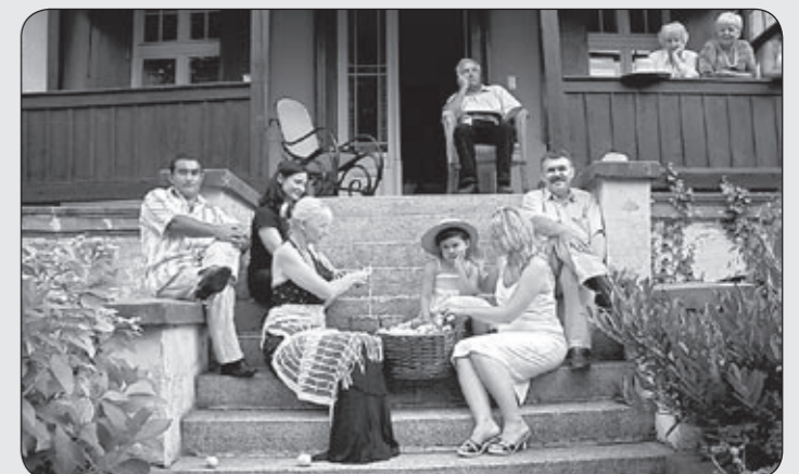
Oborniki 2009.

Jeżeli zechcecie Państwo podzielić się z nami „portretem w czasie”, w naszych Galeriach-portretach (zakładka w prawym menu strony głównej www.oborniki-slaskie.pl ) założymy kolejny zbiór: „Portret w czasie”. Załączek już jest: Kobylec 1923 – Oborniki Śląskie 2009. One są z letniej pory, ale portret w czasie ograniczeń czasowych mieć nie może. Zachęcam – bardzo. Do podzielenia się z nami, i zgody na publikację – jeszcze bardziej!